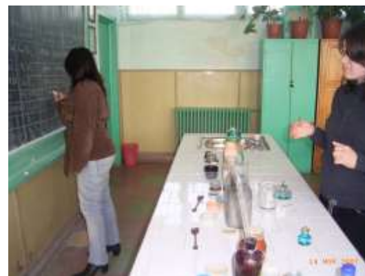
Anexa 8 Anexa 9