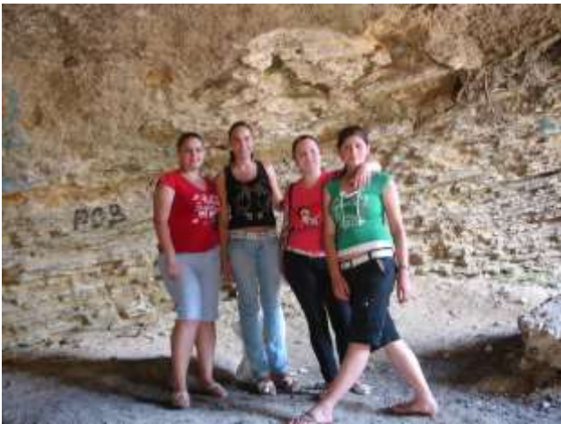
Anexa 14 Anexa15